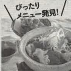
鍋焼きけんちんうどん (石岡GCウエストC, 茨城県)

体の冷え対策には、やはり温かいものを食べることです。いちばんいいのは、肉、魚、野菜、豆腐などがバランスよくとれるお鍋でしょう。ラウンド時の昼食なら、具だくさんのうどんや天