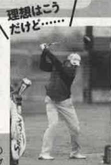
松山英樹の深いトップ