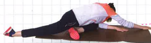
グレート&ラットストレッチ