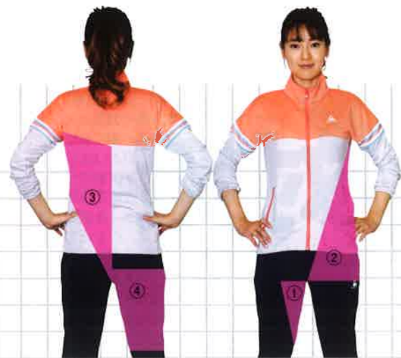
右内転筋(①)と左腹斜筋(②)、左広背筋(③)と右大でん筋(④)は筋膜でつながっている。一緒にトレーニングすると連動できるので、より効率よく動かせる

複数の筋肉を動かすストレッチで筋肉をつなげよう 胸かくと股関節のまわりの筋肉を柔らかくできたら、次は各々の筋肉を連鎖させていきましょう。筋肉がつながって動くことで、ひとつの大きな筋肉となり、パワーがさらに増して飛距離を伸ばせます。 たとえば、右内転筋(内太もも)は左腹斜筋につながり、そこから左広背筋(背中)、右大でん筋(お尻)へとつながる筋肉の流れがあります。つまり、胸かくと股関節まわりの筋肉が連結できるわけです。複数の筋肉が一緒に動くストレッチ(右ページや下記)を行って、この大きな筋肉群を連動させ、スムーズに動かせるようになりましょう。