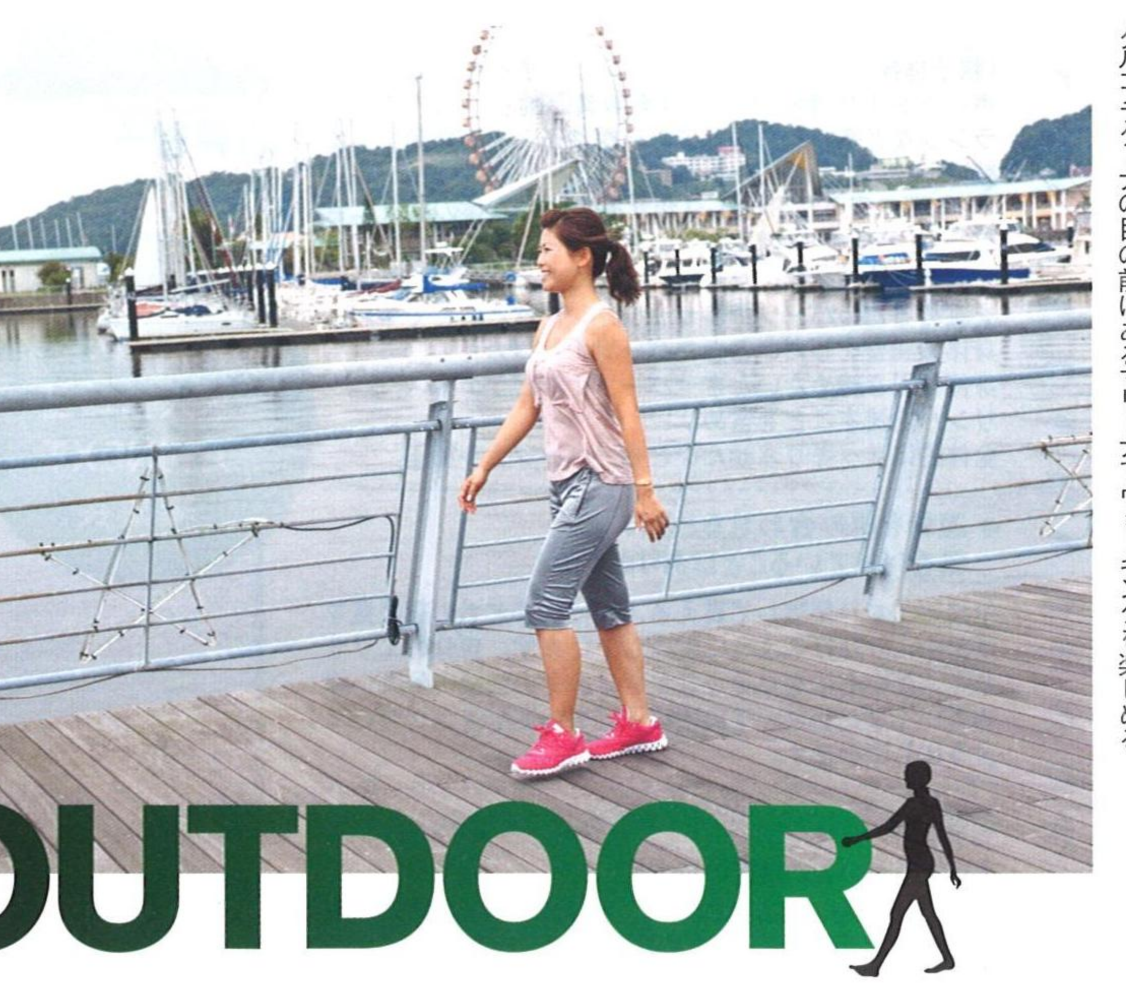
タルコラグーナの目の前にあるリーナでウォーキングを楽しめる

普段、気づかなかった鳥の鳴き声や風のそよぎ。一步、建物から外に出れば、これまではなかなか味わえなかったフィットネスの楽しみ方が見えてくる。さあ、五感のアンテナを全開にして、「アウトドアフィットネス」にチャレンジしよう！